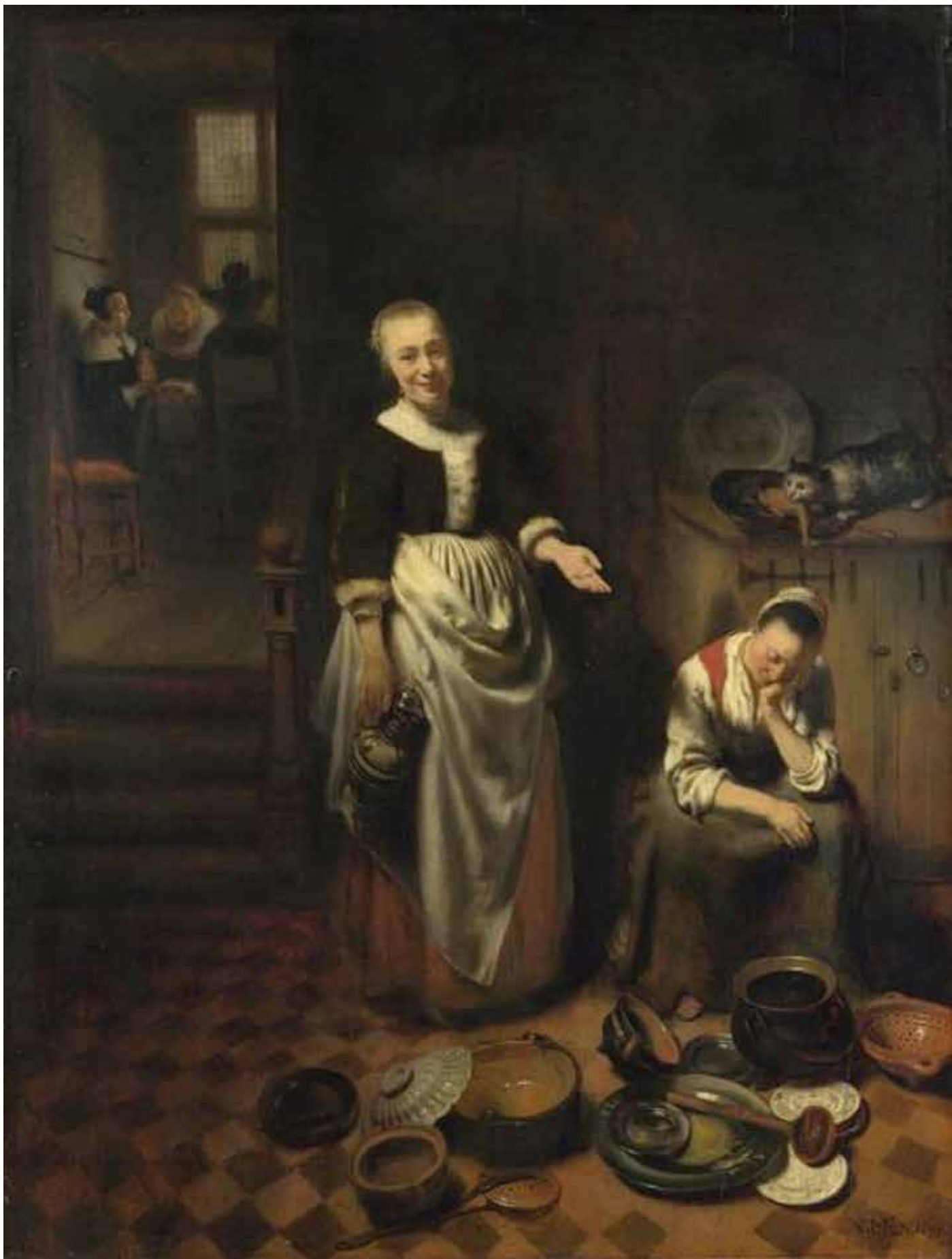
De slapende keukenmeid, 1655, Nicolaes Maes (National Gallery, Londen)