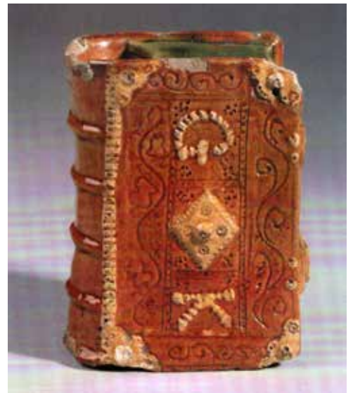
Een "boek van aerde" een boek van roodbakkend aardewerk met ingesneden en gestempelde en met slib opgelegde versiering. Loodglazuur gedateerd: 1621, bodemvondst Rotterdam.