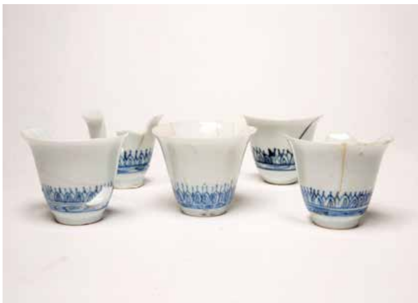
Zogenaamde "pimpelkens" 17A

Dat het Delfts grote kansen kreeg toen het Oosters porselein in het midden van de eeuw te lijden had van invoerbepalingen is in de Friese boedels niet te merken. Integendeel, tussen 1650 en 1680 komt het Delfts slechts sporadisch voor, terwijl het