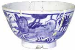
Majolica vaasje 17d en faience kom 18a