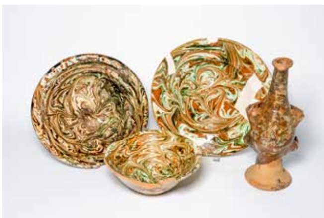
Van boven naar onder: Italië (Ligurie), Frankrijk, Spanje, Italië (Pisa).