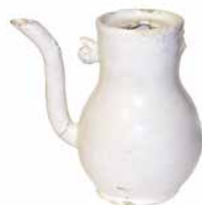
Majolica bord 17b, faïence kom 17c faïence bord en koffiekkan 18a.