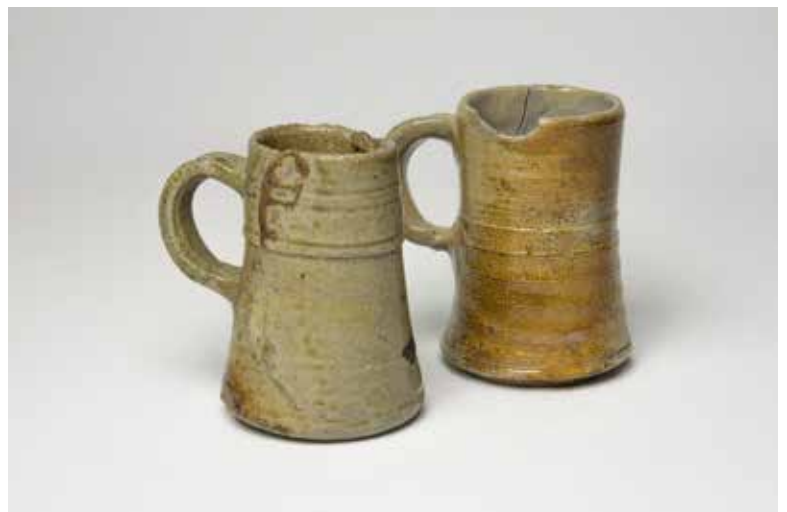
Twee zestiende-eeuwse steengoedkroezen uit Raeren. (Coll. Smeele-Van der Meulen, foto R. Tousain)

Over het Duitse steengoed is inmiddels vooral van Duitse zijde veel gepubliceerd en er zijn tal van afbeeldingen beschikbaar, echter zelden met de benamingen die in de tijd zelf in gebruik waren. In de boedels van de gebruikers vinden we die namen ook niet, zowel in Rotterdam als Friesland spreekt men van aarden of stenen kannen, waarbij soms de kleuren rood, wit of blauw worden aangegeven en de inhoudsmaat: (half)mingels, pints of vaams. De geografische herkomst die in de loop van de eeuw verschuift van Siegburg en Raeren naar Frechen en het Westervald vinden we in de boedels niet terug, met uitzondering van de Cyperse of Siperse kruik, die naar Siegburg verwijst. Een onveranderlijk